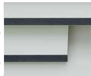
Ilustracje nie odwzorowują kolorów!