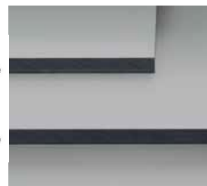
Ilustracje nie odwzorowują kolorów!